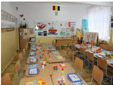
Sală de clasă

În școala noastră elevii beneficiază de un program de semi internat (părinții plătesc doar masa) De asemenea se derulează și programul Școala după școală unde elevii își fac lecțiile supravegheați de personal calificat (costurile pe anul școlar 2015/2016 au fost de 300 ron/lună)